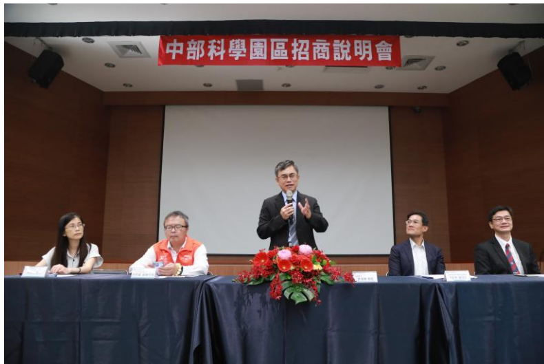
中科管理局辦理招商說明會，許茂新局長主持及答覆現場廠商提問。

(左至右: 中科管理局投資組蘇郁惠副組長、行政院中部聯合服務中心洪宗熠副執行長、中科管理局許茂新局長、國立中興大學張照勤副校長、國發會中興新村活化專案辦公室蘇玉守副主任)