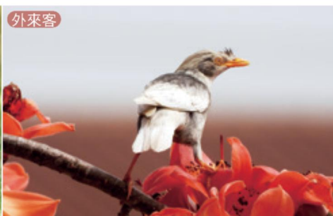
白化白尾八哥 / 數量多到竟然可以有突變種