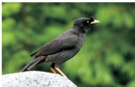
八哥 / 特有種、二級保育

目前平地常見的八哥有嘴巴黃色的「白尾八哥」及「家八哥」，只出現在臺灣西岸的原生二級保育鳥「八哥」嘴巴是象牙白。由於被棄養的白尾八哥在野外繁殖迅速，數量多到有「白化白尾八哥」的突變種，嚴重排擠食性與生態棲位相似的台灣原生種鳥類，尤其是台灣八哥，此外，白尾八哥也會趕殺麻雀幼鳥，致使城市裡的麻雀數量銳減！