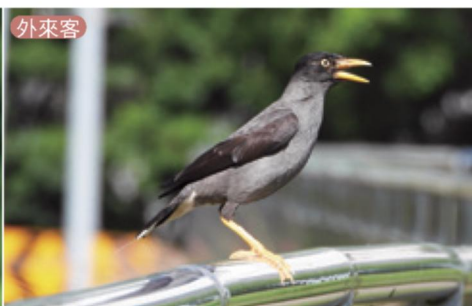
白尾八哥 / 族群最大