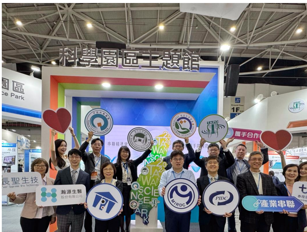
2023 台灣醫療科技展「科學園區主題館」盛大登場