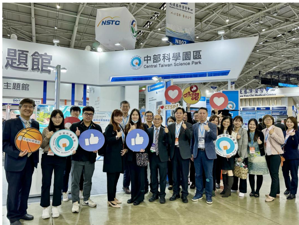
中科主題館廠商聯合展出精準健康計畫成果