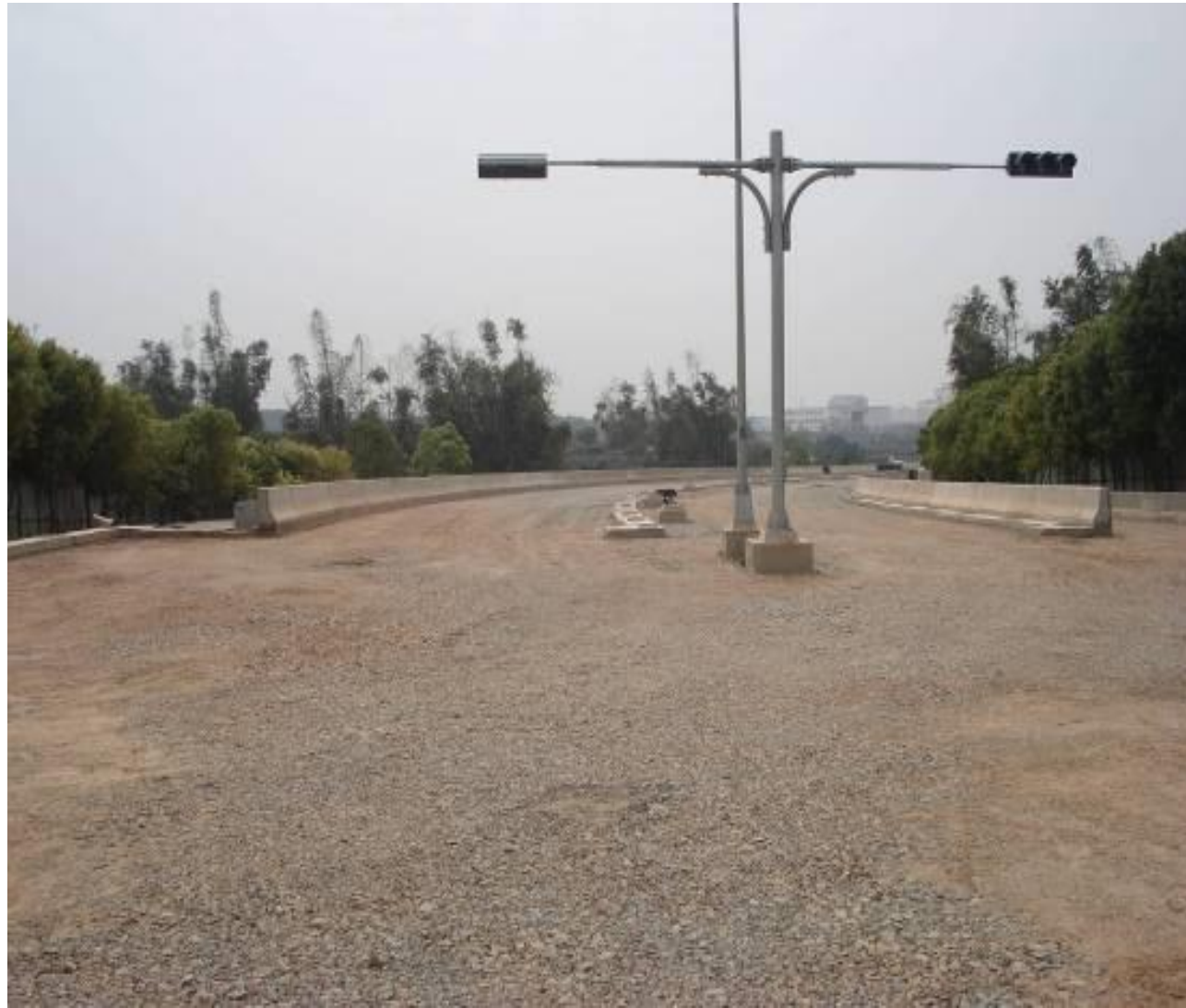
圖1-3 聯絡兼維生道路工程（基地聯絡道南橋工程）