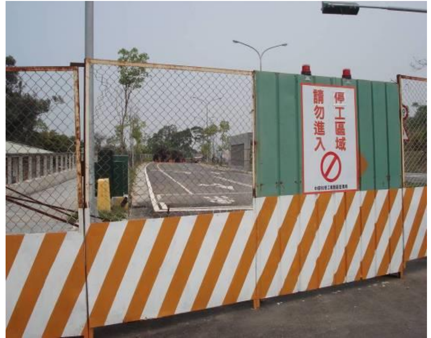
圖1-6 聯絡兼維生道路工程（旱溝跨越橋梁工程）