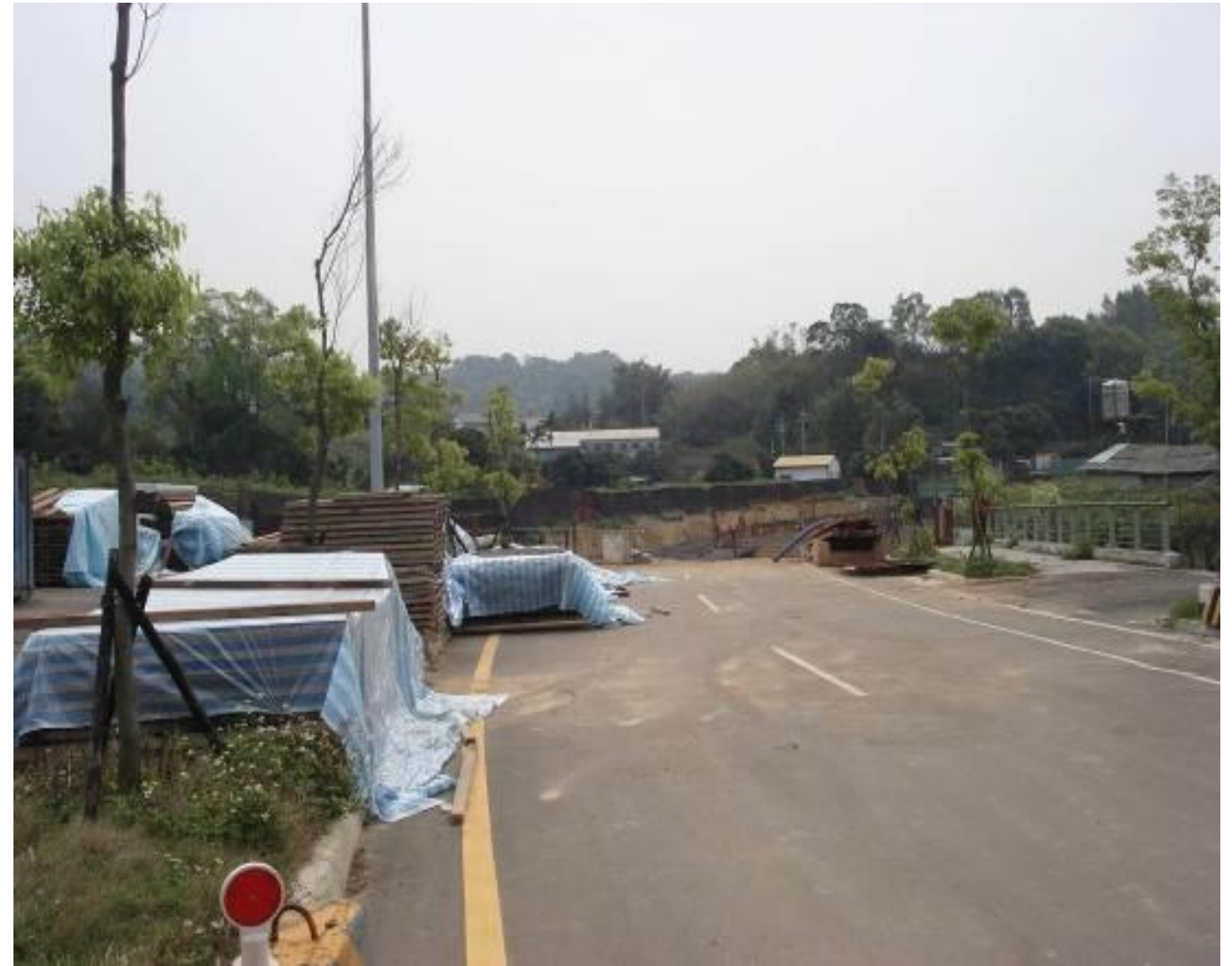
圖1-8 聯絡兼維生道路工程（旱溝跨越橋梁工程）