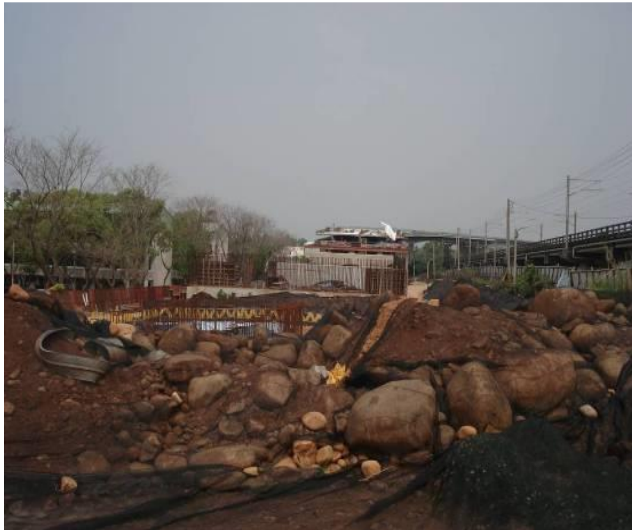
圖1-1 聯絡兼維生道路工程（基地聯絡道南橋工程）