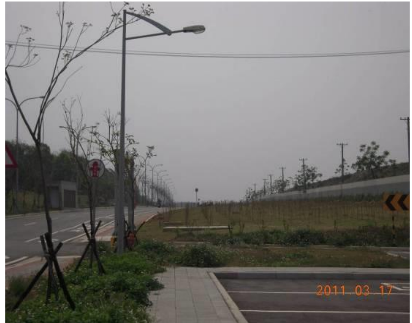
圖7 綠地工程（圖右側）及區內道路（圖左側）