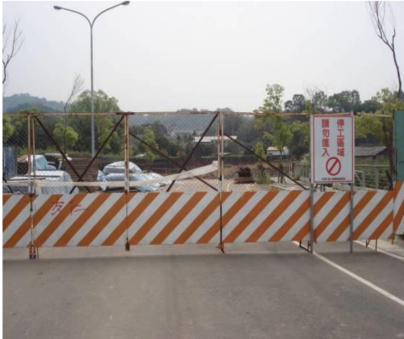
圖1-7 聯絡兼維生道路工程（旱溝跨越橋梁工程）