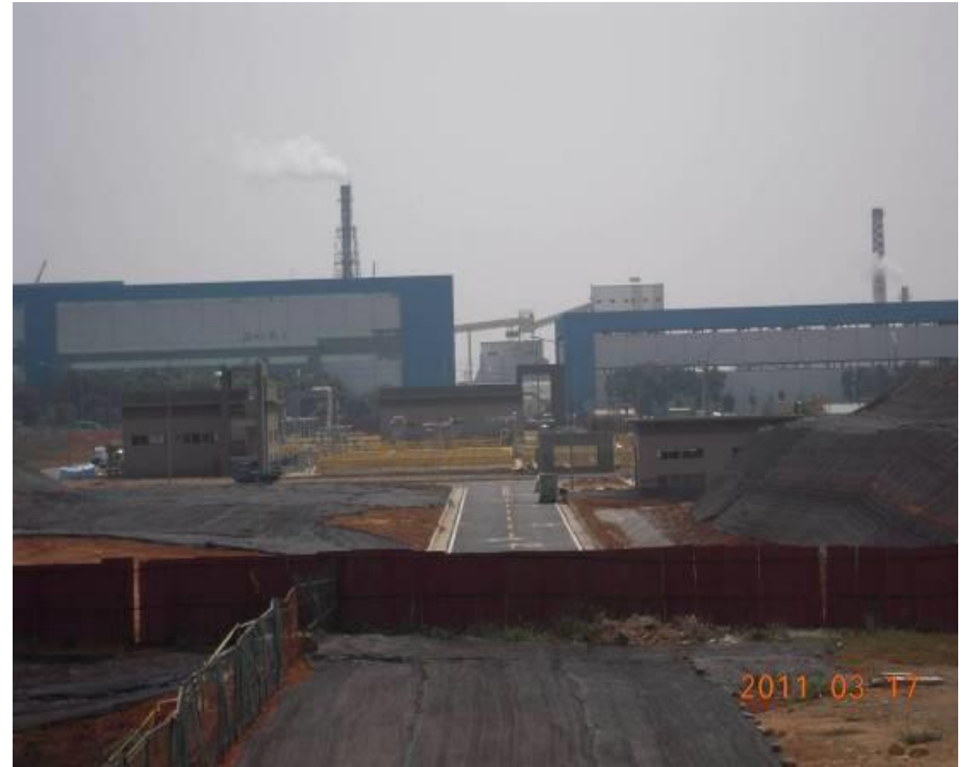
圖2-2 污水處理廠一期一階工程