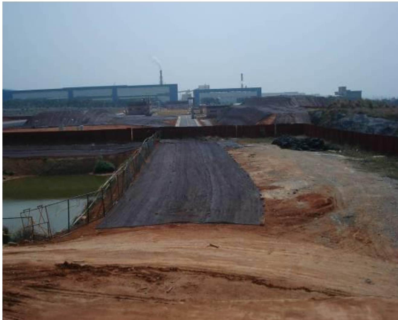
圖4-3 土石方暫置及處理作業（環保設施用地北側：污水處理廠旁）