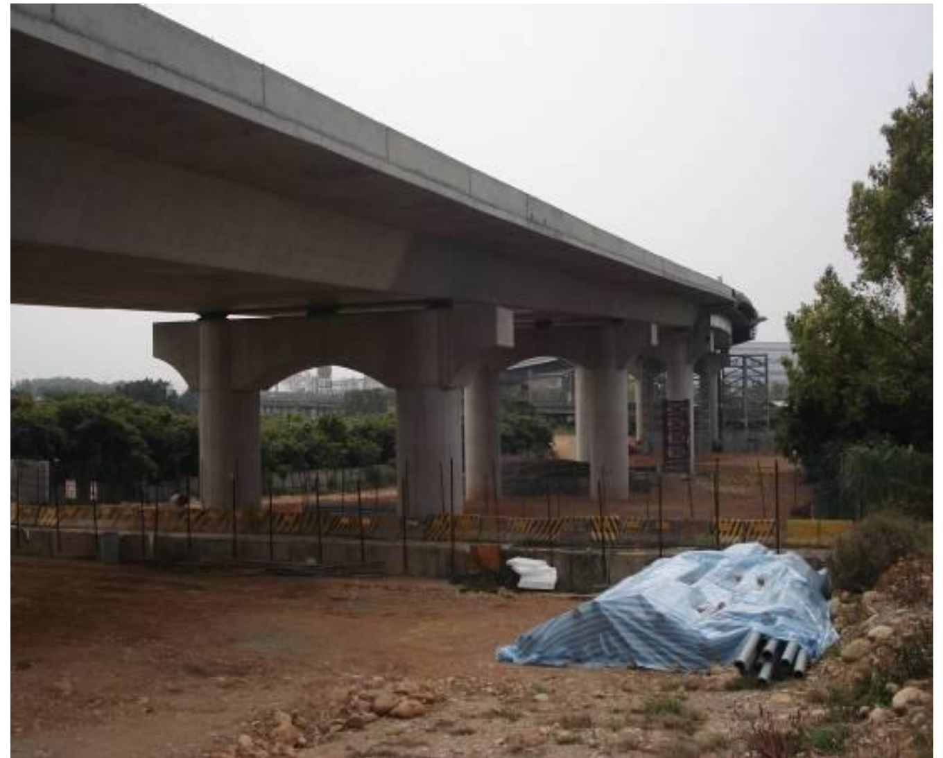
圖1-2 聯絡兼維生道路工程（基地聯絡道南橋工程）