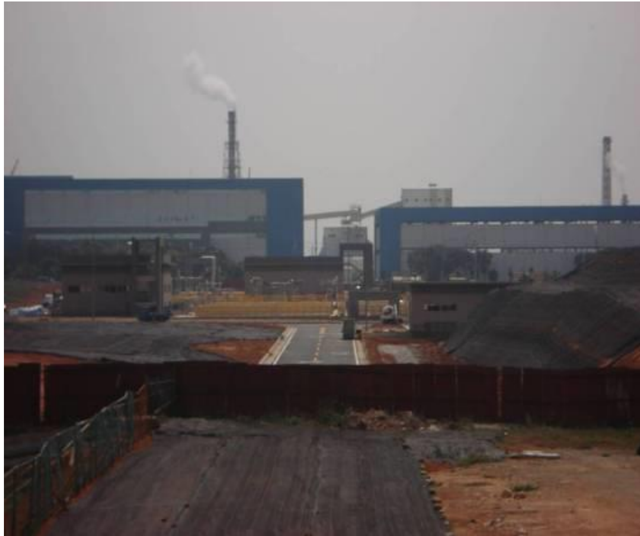
圖2-1 污水處理廠一期一階工程