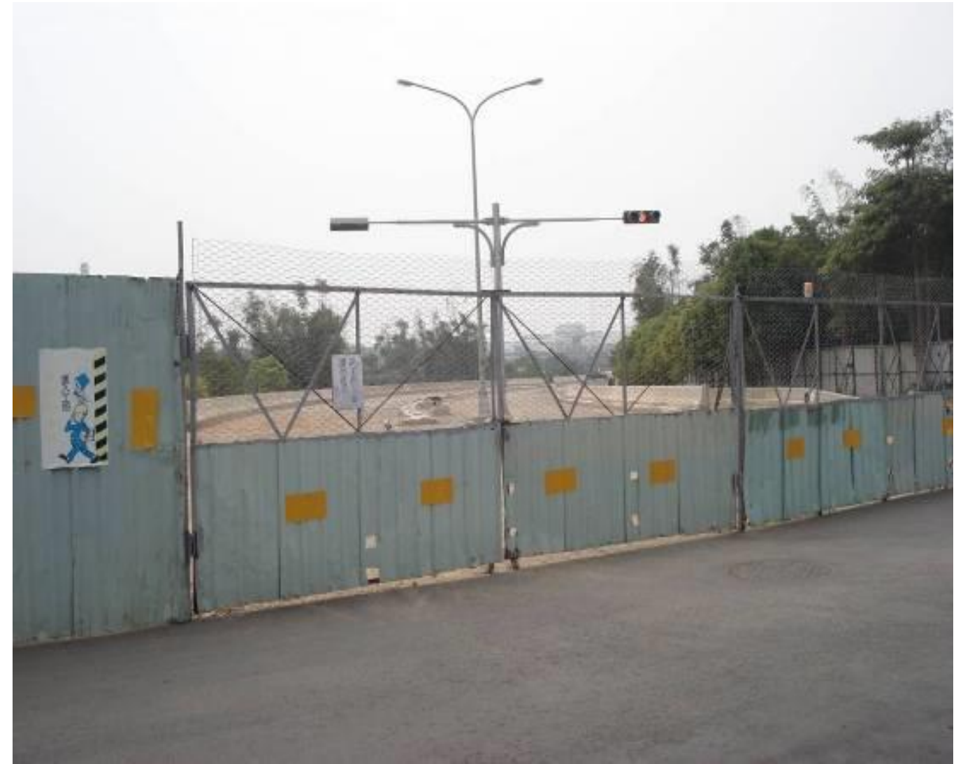
圖1-4 聯絡兼維生道路工程（基地聯絡道南橋工程）