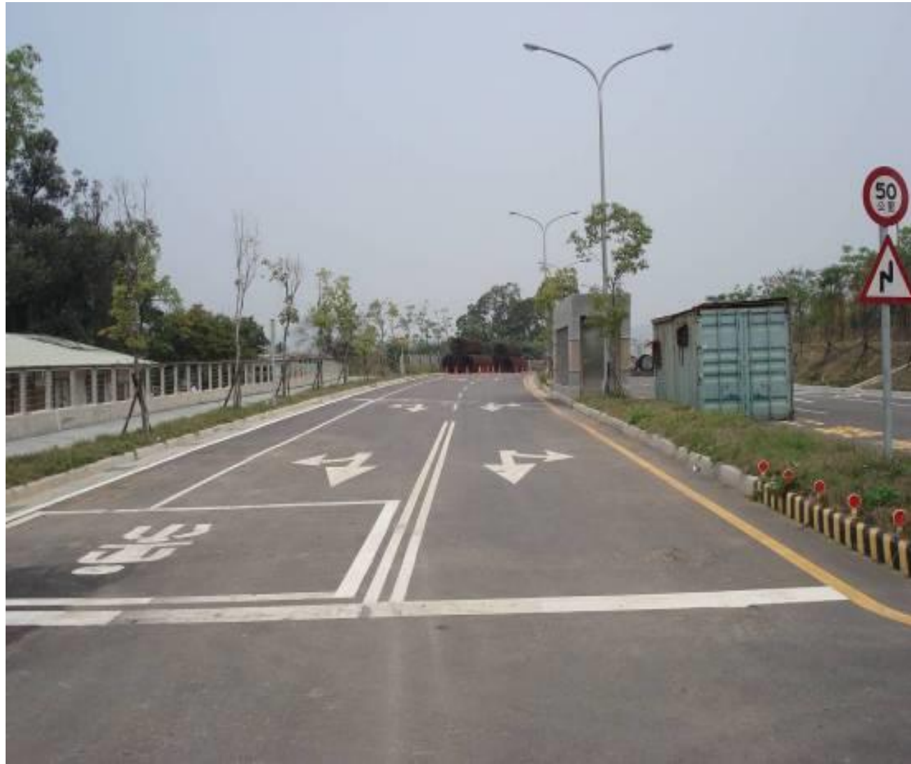
圖1-5 聯絡兼維生道路工程（旱溝跨越橋梁工程）