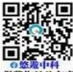
悠遊中科 QR CODE

這次『發現中科之美』攝影比賽活動是以促進「民眾參與」的目標規劃舉辦，實際進入中科園區拍攝美景的參賽者包括社會各界攝影高手、大專院校相關科系師生以及園區從業人員等，成功營造「園區與社區」的友善互動，也讓中科園區在營業額成長的同時，展現「科技與人文」并重的優質文化，更為園區發展蓄積更深厚的軟實力。歡迎大家在精彩攝影作品的引領下走進園區，一起來發現中科之美。