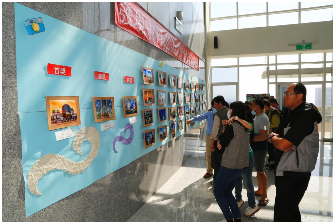
▲民眾駐足欣賞典禮現場展出的 40 件得獎作品