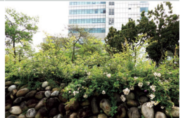
108 年管理局後方綠地大肚山薔薇開始復育情形