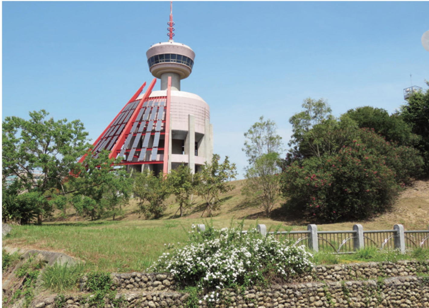
南區高架水塔旁自生族群