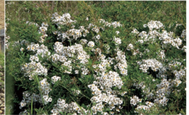
綠 10- 最早發現大肚山薔薇的地方