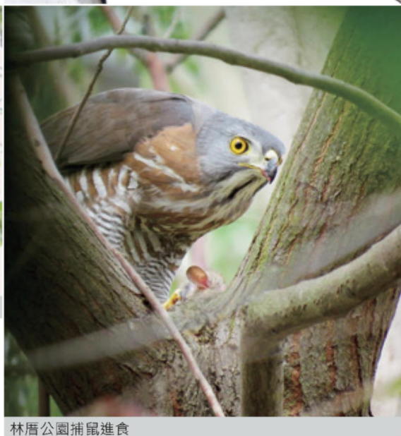
林厝公園捕鼠進食