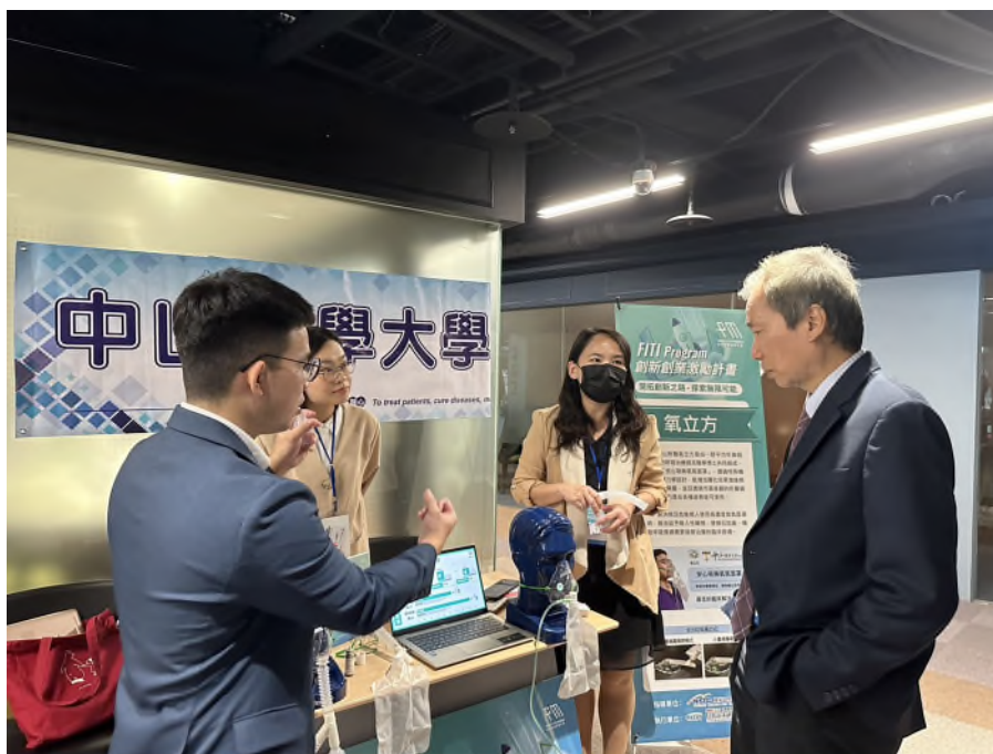
「氧立方」團隊向中科許正宗副局長說明「安心吸藥氧氣面罩」的特殊機構及流體力學設計