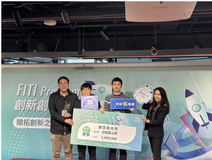
中科輔導團隊「台大介觀生醫」獲得傑出獎 100 萬元