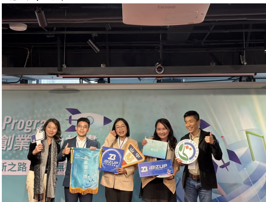
中科輔導團隊「氧立方」獲得潛力獎 20 萬元