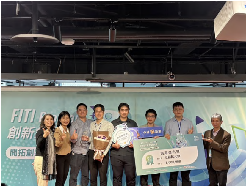
中科輔導團隊「TPDH」獲得傑出獎 100 萬元