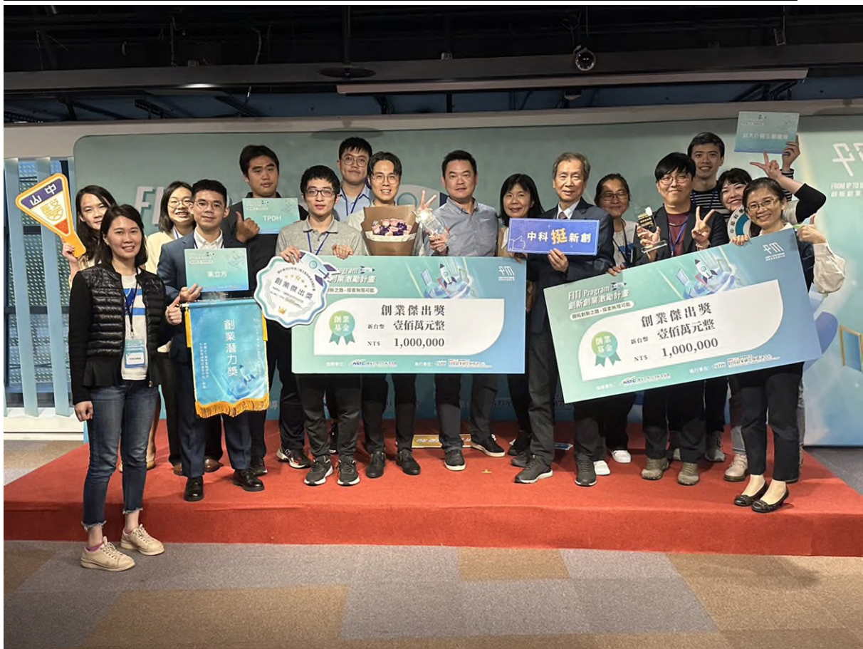
中科輔導獲獎團隊喜抱獎項與獎金