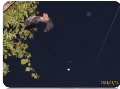
臺灣葉鼻蝠 (虎山線)