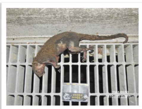
赤腹松鼠 ( 1 )