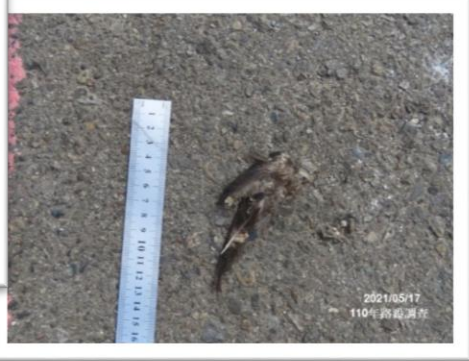
洋燕 ( 2 )