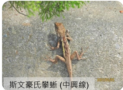
斯文豪氏攀蜥 (中興線)