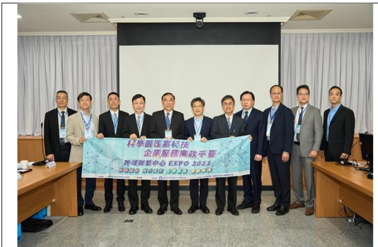
圖 1:法務部部長蔡清祥(左五)、國科會陳宗權副主委(左六)及中科管理局許茂新局長(右五)與多位園區企業代表共同與會中部科學園區管理局「科學園區高科技企業服務廉政平臺跨域聯繫中心 EXPO 2023」活動。

國家科學及技術委員會與法務部將賡續攜手合作推動「科學園區高科技企業服務廉政平臺」，並積極透過溝通聯繫及跨域合作機制，凝聚公私部門共識，跨域攜手合作共創誠信優質投資環境，共同達成國家經濟永續發展的目標，帶動科技產業經濟價值與誠信治理的對話機會，深具正面意義。