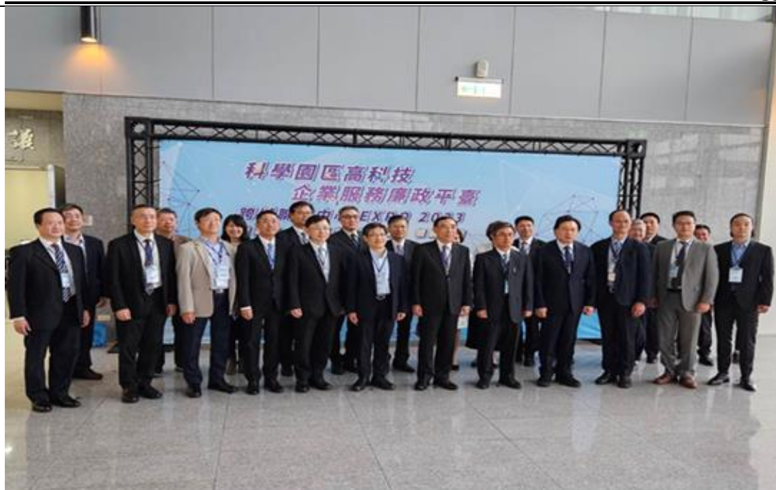
圖 2: 法務部部長蔡清祥、國科會陳宗權副主委及中科管理局許茂新局長與多位園區企業代表暨檢調單位高階主管，於中部科學園區管理局「科學園區高科技企業服務廉政平臺跨域聯繫中心 EXPO 2023」活動合影。