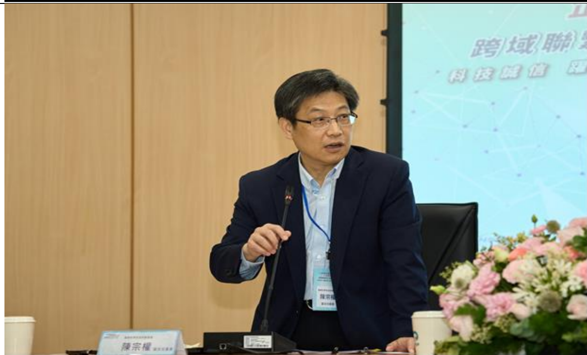
圖 4：國科會陳宗權副主委致詞。