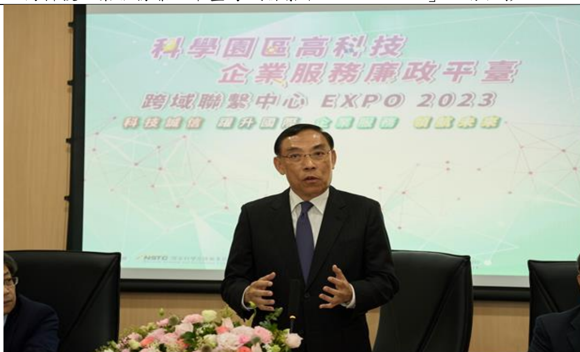
圖 3: 法務部部長蔡清祥致詞。