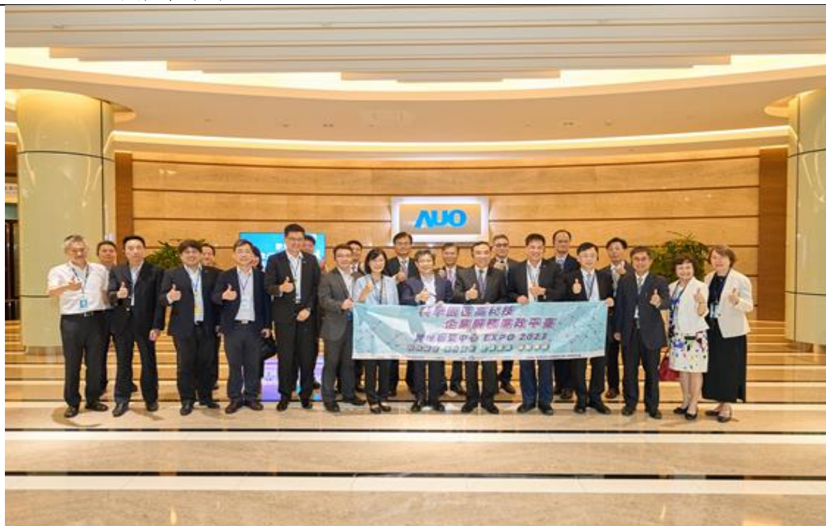
圖 5：法務部部長蔡清祥、國科會陳宗權副主委及中科管理局許茂新局長與多位園區企業代表暨檢調單位高階主管，前往友達光電股份有限公司進行企業參訪。