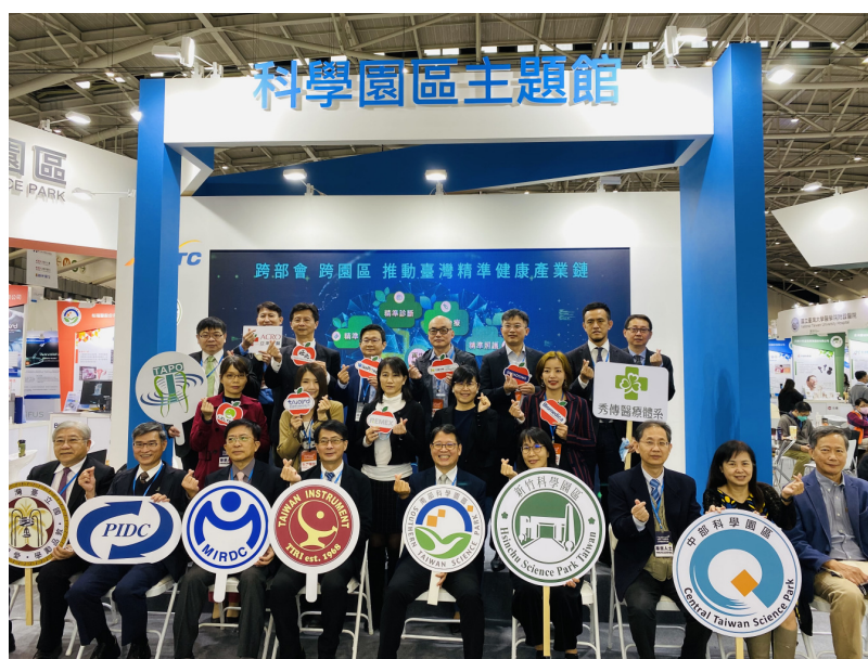
三科學園區管理局、國研院儀科中心與經濟部工業局共同辦理聯合成果發表會。