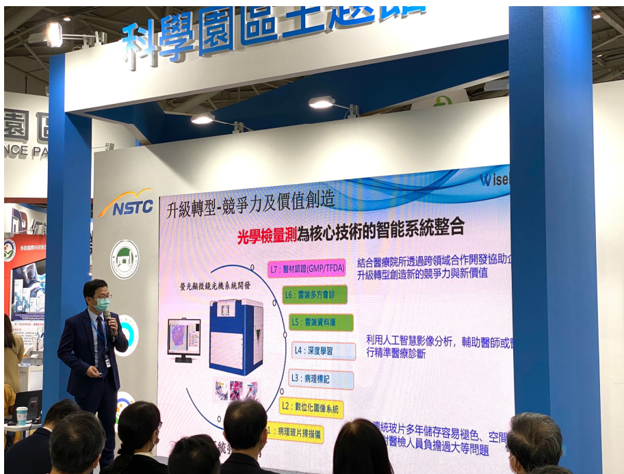
旭東機械發表執行「數位玻片螢光掃描儀開發計畫」成果