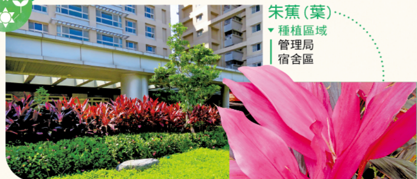
朱蕉(葉) ▼種植區域 | 管理局 | 宿舍區