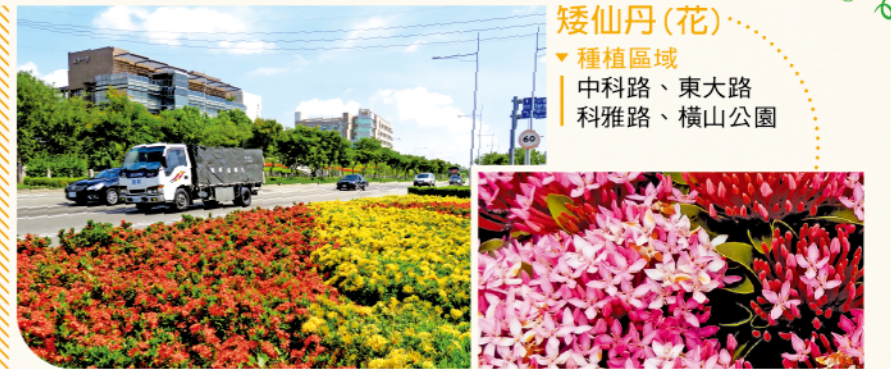
矮仙丹(花) ▼種植區域 | 中科路、東大路 | 科雅路、橫山公園