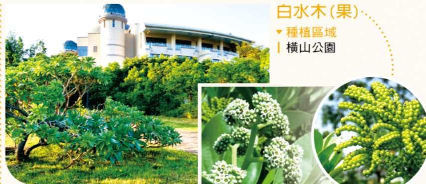
白水木(果) ▼種植區域 | 橫山公園