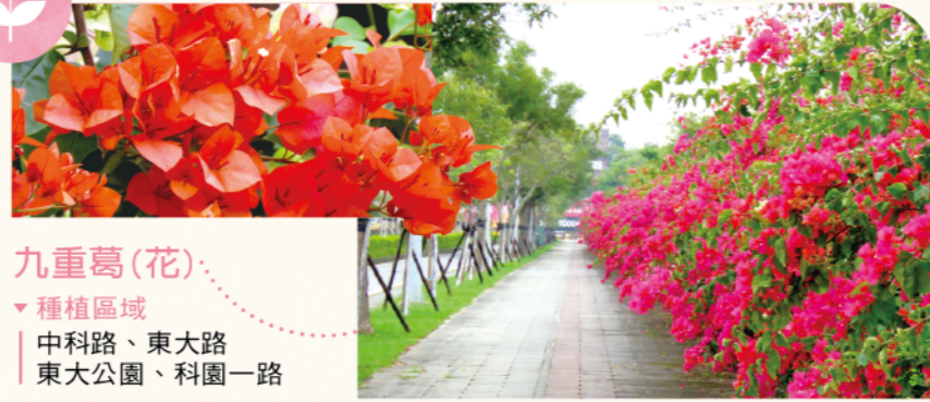
九重葛(花) ▼種植區域 | 中科路、東大路 | 東大公園、科園一路