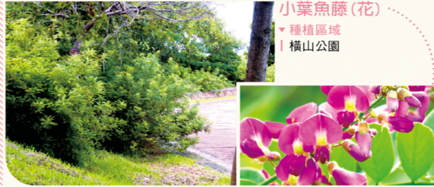
小葉魚藤(花) ▼種植區域 | 橫山公園