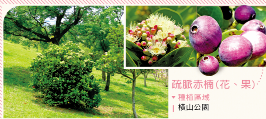
疏脈赤楠(花、果) ▼種植區域 | 橫山公園