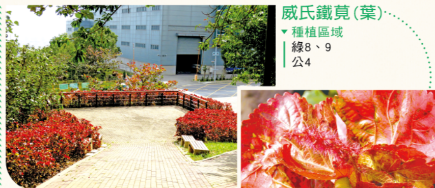
威氏鐵莖(葉) ▼種植區域 | 線8、9 | 公4