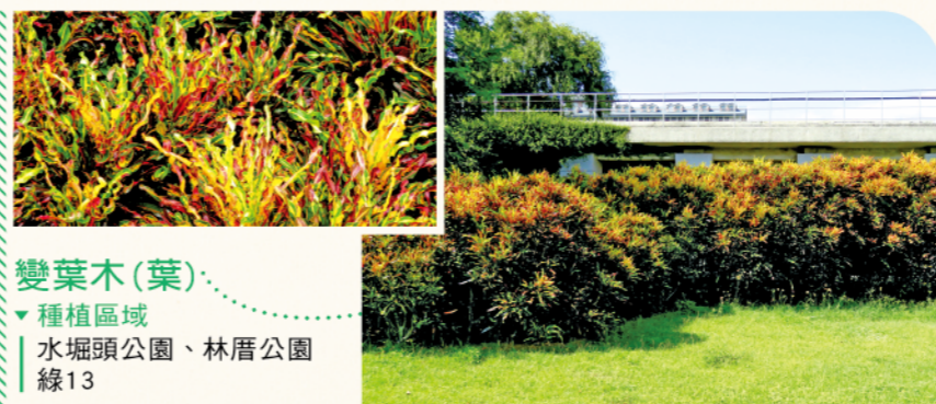
變葉木(葉) ▼種植區域 | 水堀頭公園、林厝公園 | 線13