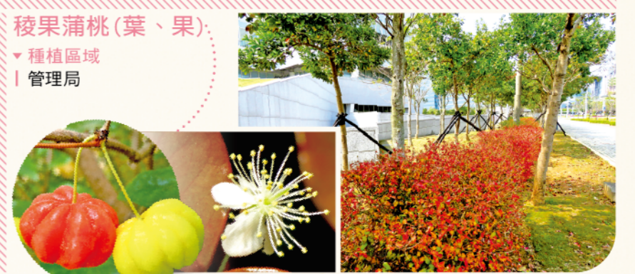
稜果蒲桃(葉、果) ▼種植區域 | 管理局