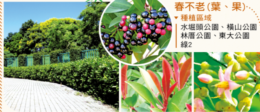
春不老(葉、果) ▼種植區域 | 水堀頭公園、橫山公園 | 林厝公園、東大公園 | 線2