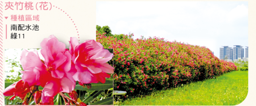
夾竹桃(花) ▼種植區域 | 南配水池 | 線11