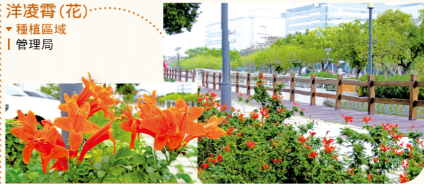
洋凌霄(花) ▼種植區域 | 管理局