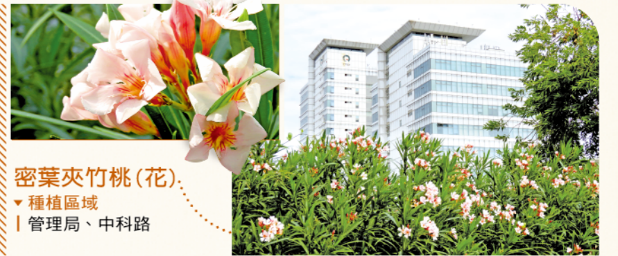
密葉夾竹桃(花) ▼種植區域 | 管理局、中科路