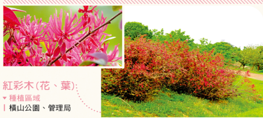
紅彩木(花、葉) ▼種植區域 | 橫山公園、管理局