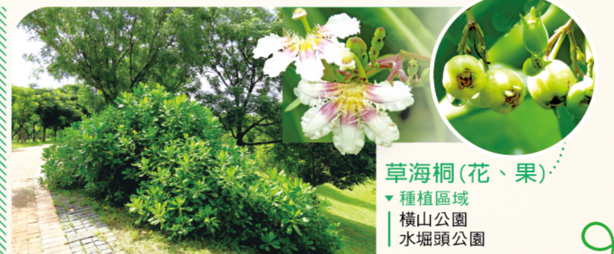
草海桐(花、果) ▼種植區域 | 橫山公園 | 水堀頭公園