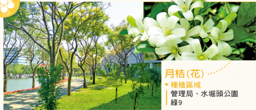
月桔(花) ▼種植區域 | 管理局、水堀頭公園 | 線9