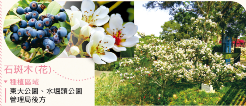
石斑木(花) ▼種植區域 | 東大公園、水堀頭公園 | 管理局後方