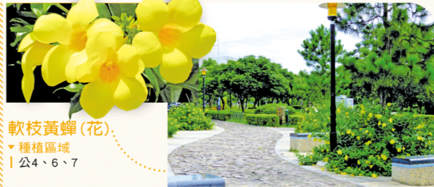
軟枝黃蟬(花) ▼種植區域 | 公4、6、7