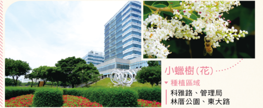
小蠟樹(花) ▼種植區域 | 科雅路、管理局 | 林厝公園、東大路