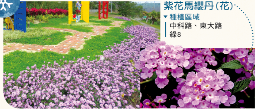
紫花馬纓丹(花) ▼種植區域 | 中科路、東大路 | 線8