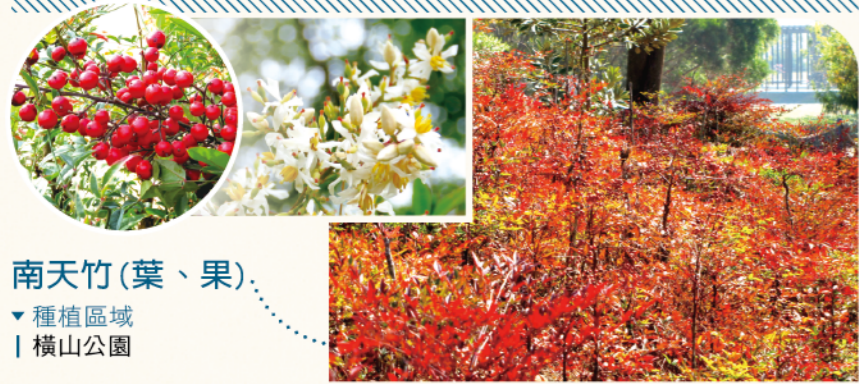
南天竹(葉、果) ▼種植區域 | 橫山公園