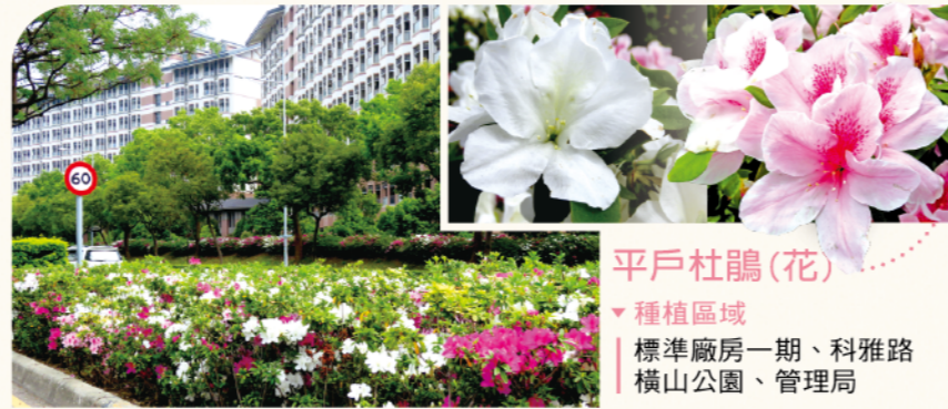
平戶杜鵑(花) ▼種植區域 | 標準廠房一期、科雅路 | 橫山公園、管理局