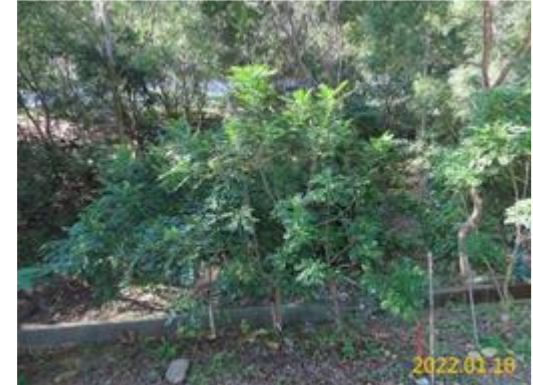
狗花椒植栽復育現況