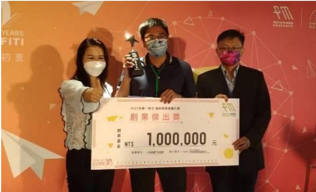
▲ 中科輔導「智在嘉鄉·投筆從農」團隊勇奪「創業傑出獎」獎牌及百萬獎金