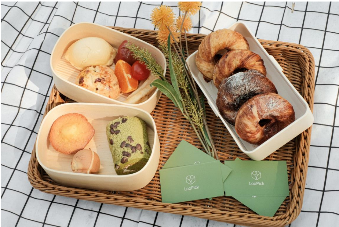
▲ 中科輔導「LooPick 循拾」團隊以環保餐盒出發，提供循環餐飲服務。