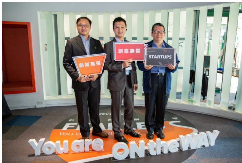
無電燄 City 獲頒創業潛力獎