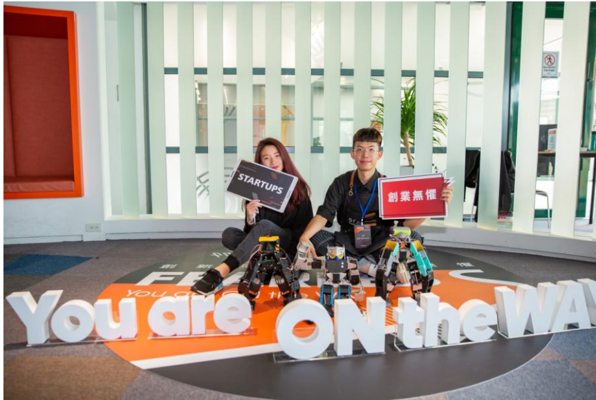
GTA Robotics 獲頒創業潛力獎