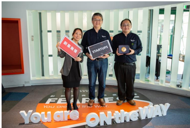
VM-FI 聲麥無線獲頒創業潛力獎